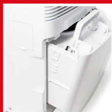
Serbatoio per la raccolta della condensa facilmente rimovibile Condensate collection tank easy to be removed