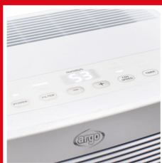
Pannello di controllo "user-friendly" User-friendly control panel

Appreciated for its simplicity of form and small size, it performs perfectly in humid environments, private or public. It also works at low temperatures and condensate collection is monitored by a light, which illuminates when the tank is full.