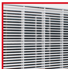
Filtro dell'aria sull'aspirazione, rimovibile per la pulizia Air filter on the air inlet, removable for cleaning