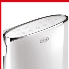
Pannello comandi digitale Digital control panel

ARGO PLATINUM EVO dehumidifier is an example of elegance and functionality. The particular care of the stylistic detail and refined finishes, give it an important visual plus. Highly performing in its functionality, it is equipped with a special one for drying your laundry.