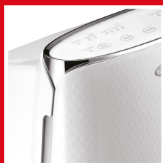
Top design e materiali pregiati, finitura high-gloss Top design and choice materials, high-gloss finish