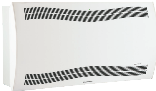
CDP-Modell für den Schwimmbadbereich – Wandmontage oder Bodenaufstellung