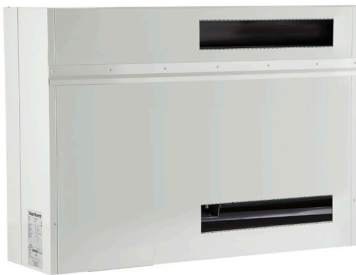
CDP-T-Modell für die Installation im Nebenraum