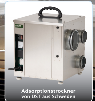
Adsorptionstrockner von DST aus Schweden