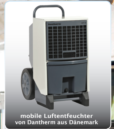
mobile Luftentfeuchter von Dantherm aus Dänemark